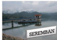
Tahun 1992 Empangan Talang