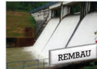
Tahun 1998 Empangan Kelinehi