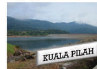
Tahun 1999 Empangan Gemenchek